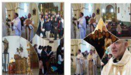
RECORRIDO MARIANO DE LAS MUJERES FEBE.